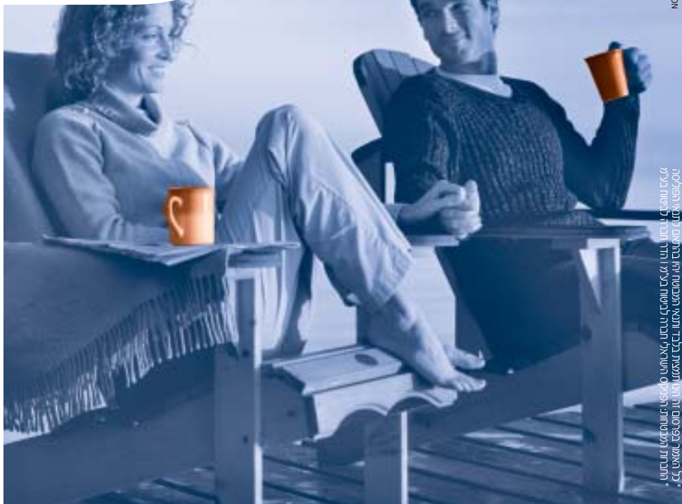
מקאמני אריקסון * כל האמור בפירוט זה הינו תמצית בלבד ותמצית תמצית ויש להתייעץ עם יועץ המכירות

קן הפנסיה "עמית" מקבוצת הפניקס, נבחרה ע"י התאחדות בתי המלון ואיגוד עובדי בתי המלון כקן הפנסיה שתבטח את עובדי המלונות