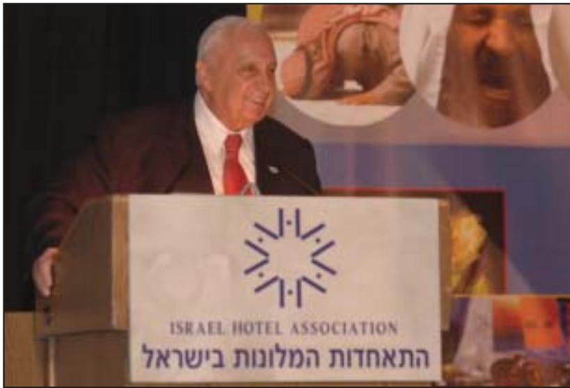
ראש הממשלה ברוגה של נחת