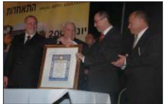
שר החוץ סילבן שלום