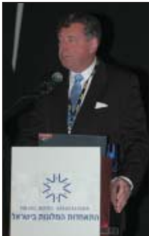
יו"ר התאחדות המלונות הבין-לאומית ג'ון בל