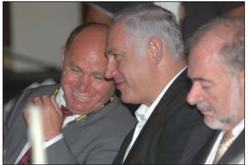
ממתקים סוד (מימין לשמאל): שר התיירות, שר האוצר, נשיא ההתאחדות