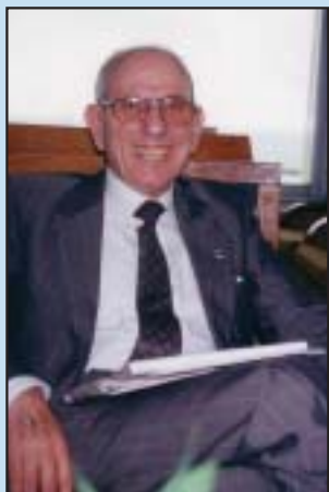
ינוש דמון: האיגוד הוותיק בעולם

האוניברסיטה העברית (הפקולטה ברחובות), אוניברסיטת בן גוריון ומיכללת עמק הירדן מעניקות תארים במלונאות. אבל התלונה שבפיהם היא שהבוגרים לא זוכים במלונות בקבלת הפנים הראויה ולכן יותר משני שלישי מן הבוגרים עוזבים את הענף. הבעייה היא