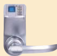
מנעול טביעת אצבע

הפעלה ידנית, מכנית או חשמלית (התאמה לשומרי שבת) • בריחי נחושת ולשוניות פלדה • תצורת שינוע גמישה • מערכת קידוד מותאמת להנפקה מהירה ופשוטה של כרטיסים חכמים.